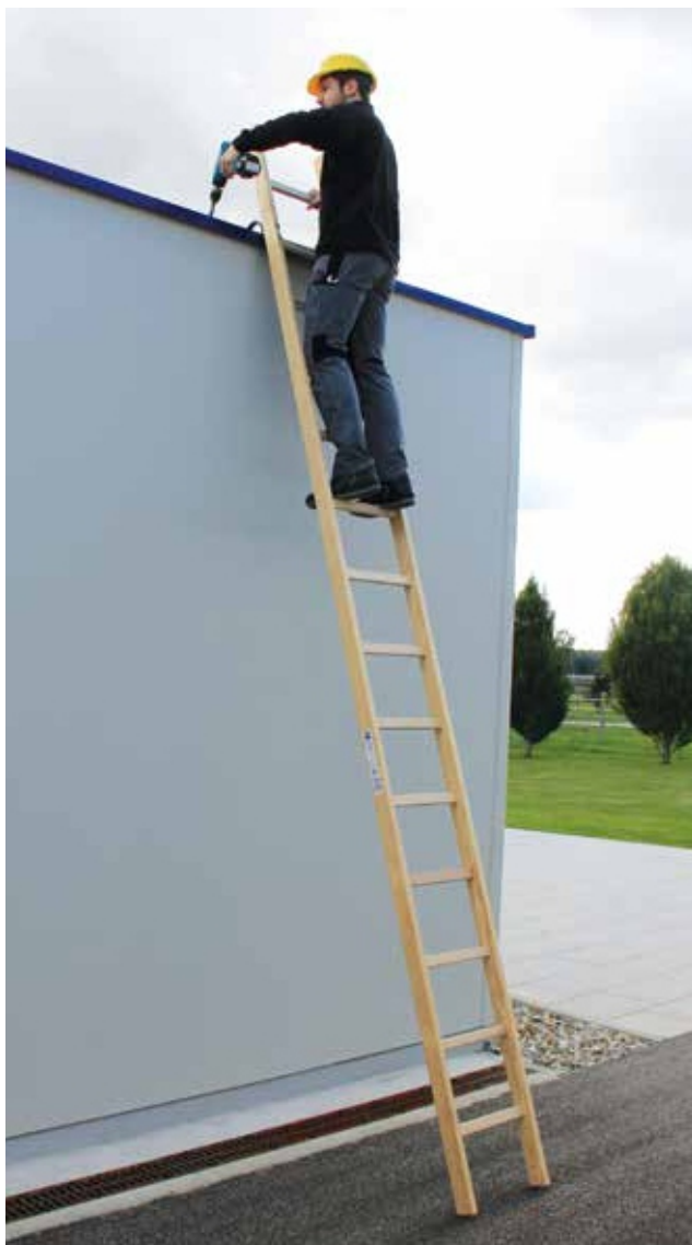
Артикул № 33114, крепление лестницы с помощью крючка