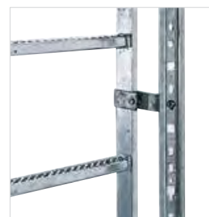
Артикул № 77545