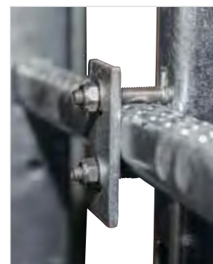
Артикул № 77536