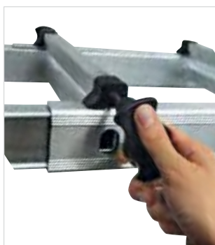
Артикул № 32021