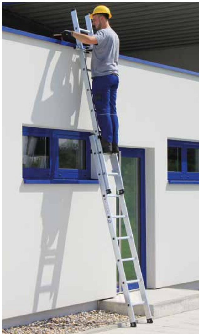
Артикул № 20208