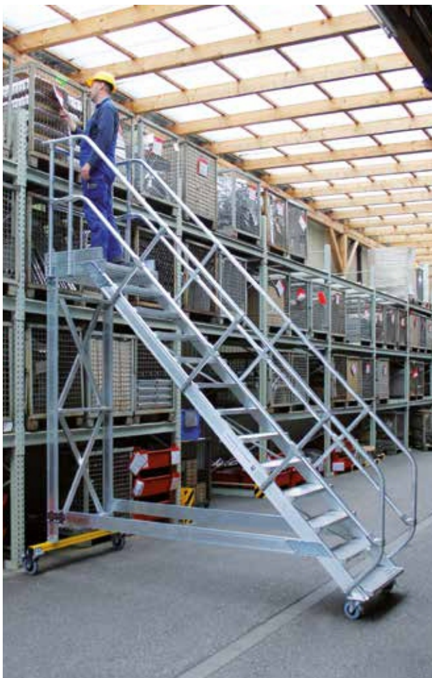
Артикул № 300793