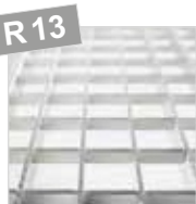
Алюминиевая решетка, анодированная