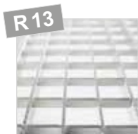
Алюминиевая решетка, анодированная