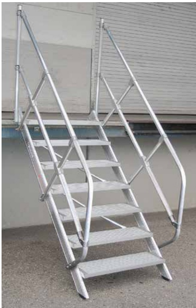
Артикул № 300247 с двумя поручнями артикул № 300307