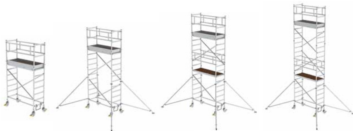
Передвижные леса из алюминия с регулируемыми опорами **, платформы с интервалом 2,0 м.