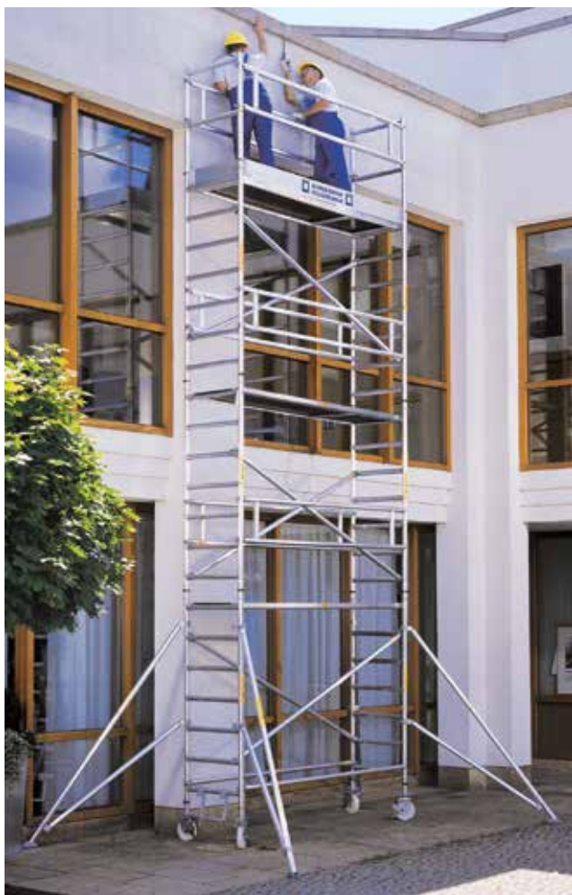
Артикул № 155646